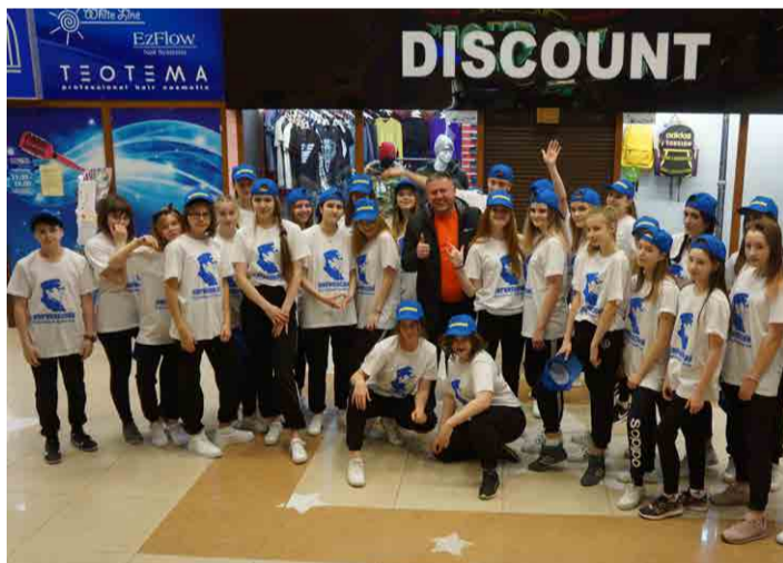
Флешмоб молодежной организации Магаданского регионального отделения ЛДПР.

ния ЛДПР ежедневно ведётся приём избирателей в независимости от политической принадлежности. По итогам 2018 год к нам поступило более 1 тысячи обращений. А если быть точным, то 1097. У нас на контроле находится каждое обращение, каждого обратившегося за поддержкой ЛДПР человека. Людей волнуют вопросы социального обеспечения, совершенствования пенсионного законодательства и деятельности правоохранительных органов, вопросы трудоустройства, высоких тарифов на услуги ЖКХ. Все эти вопросы должна решать власть, но, к сожалению, обозначенной людьми проблематике должного внимания не уделяется. Только благодаря бескомпромиссной позиции депутатов и представителей ЛДПР, нашим настойчивым запросам в органы исполнительной власти, руководство области и городских округов было вынуждено считаться с мнением народа. При нашем участии сдвинулась с мертвой точки тема вывоза мусора — создан региональный оператор, который должен обеспечить чистоту на контейнерных площадках. Практически закончился бардак на рынке авиаперевозок — анонсированы новые рейсы и новые направления, стабилизировались тарифы. Годом ранее именно ЛДПР добились долгожданного выравнивания энерготарифов для Магаданской области. Мы входим в 2019 год с большими планами и серьезными задачами.