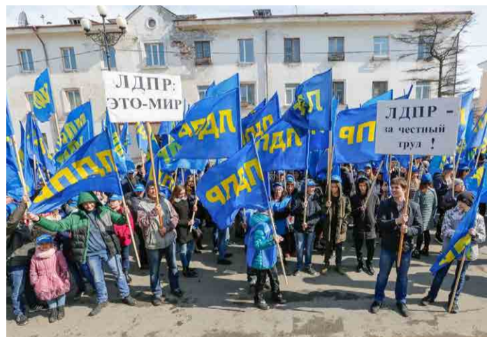
Участие активистов Магаданского регионального отделения ЛДПР в Первомайской демонстрации.