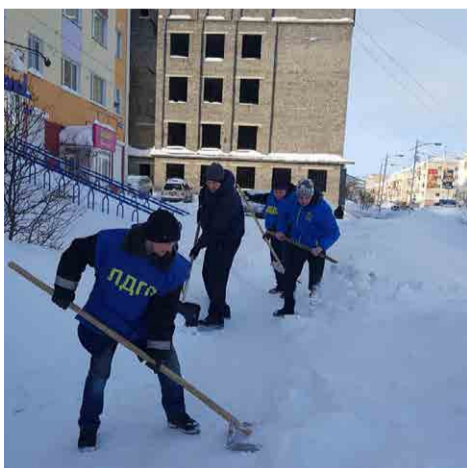
Субботник активистов Магаданского регионального отделения ЛДПР.