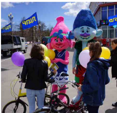
Пикет активистов Магаданского регионального отделения ЛДПР, посвященный Дню защиты детей