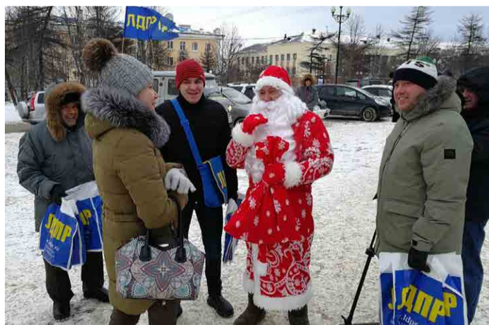
Пикет активистов Магаданского регионального отделения ЛДПР, посвященный Новому году.