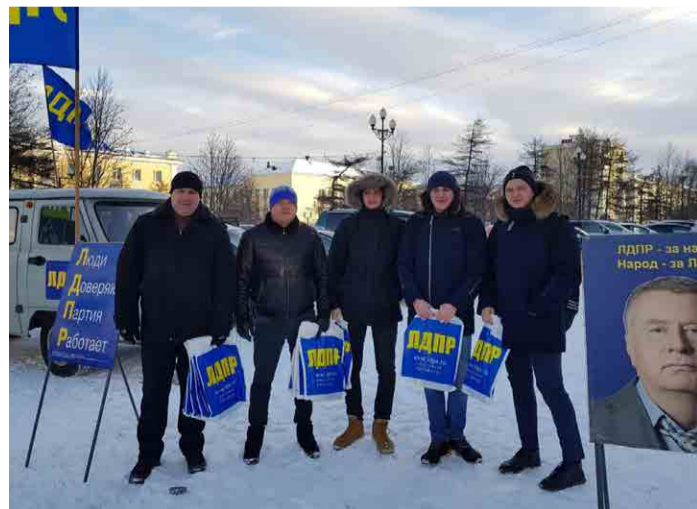
Мобильная приемная Магаданского регионального отделения ЛДПР.

Уважаемые читатели! Издательство принимает книги и брошюры ЛДПР, выпущенные до 2005 года, в обмен на новые. Просим вас отправлять издания ЛДПР по адресу: 107078, г. Москва, 1-й Басманный пер., д. 3, стр. 1. Телефоны: 8 (499) 263-13-74, 263-12-96.