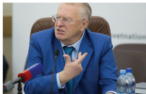
В.В. Жириновский - Лидер партии ЛДПР.

Тем более разные партии настроены злобно и противостоят друг другу, любой сигнал о взятке они с удовольствием вскроют, чтобы долбануть своего конкурента, оппонента. Вот на это и нужно делать ставку», — неоднократно говорил Владимир Жириновский.