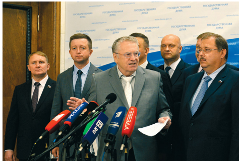
В.В. Жириновский - лидер партии ЛДПР.